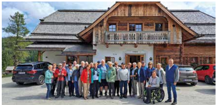
Tagesausflug Günstner Wasserfälle - Prebersee