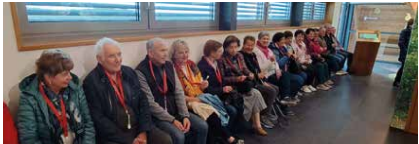
Die Zweitagesfahrt Oststeiermark