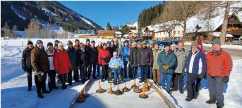
1. Eisschießen gegen die Ortsgruppe St. Peter

vieler Ortsgruppen. Die am weitesten angereiste Gruppe war Trofaiach, was die Bedeutung dieses Wandertags über die Bezirksgrenzen hinaus betonte. Im Gegensatz dazu beeindruckte die Ortsgruppe Weißkirchen durch die höchste Teilnehmerzahl, was ihre tiefe Verbundenheit und ihre Unterstützung für die Aktivitäten des Seniorenbundes verdeutlichte.