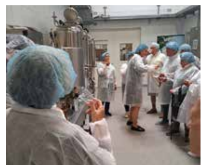
Besichtigung Brauerei Thalheim