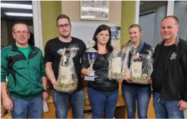
Siegerteam Alex Crew