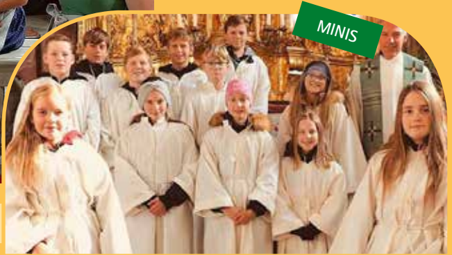
Pfarrteam St. Oswald Möderbrugg