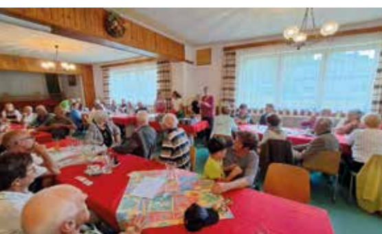
Preisverlosung beim Fischessen