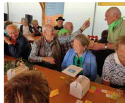
7. Bezirkswandertag: Preisverlosung